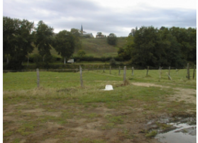
Vue du site BDHE 6308 point de repère 6190