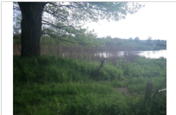
Vue du site BDHE 6306 point de repère 6186