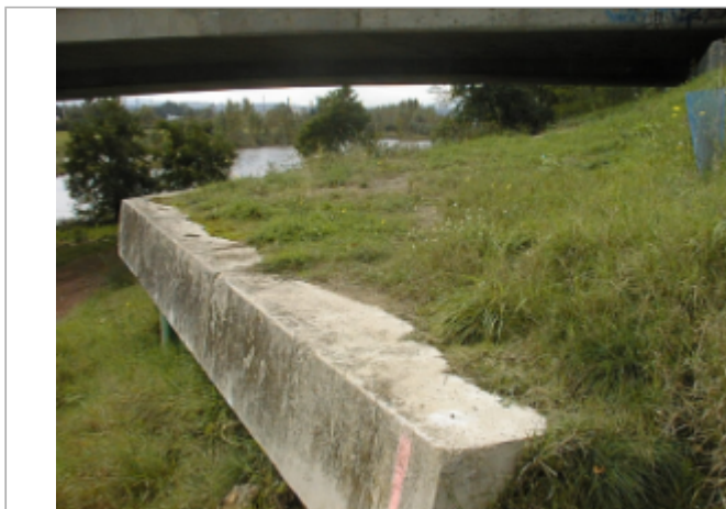
Vue du site BDHE 6304 point de repère 6178