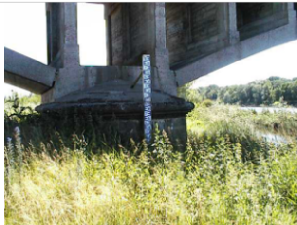
Vue du site BDHE 6037 point de repère 6172 (source: DIREN Centre)