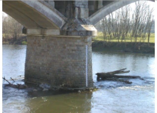
Vue du site BDHE 6022 point de repère 6027