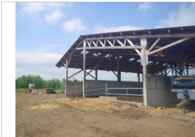
Vue du site BDHE 6013 point de repère 6180