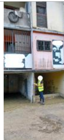
Route de Besson - Résidence, magasin d'accessoires automobiles

Coordonnées RGF93 (ETRS89) : X: -61.521165 / Y: 16.239376