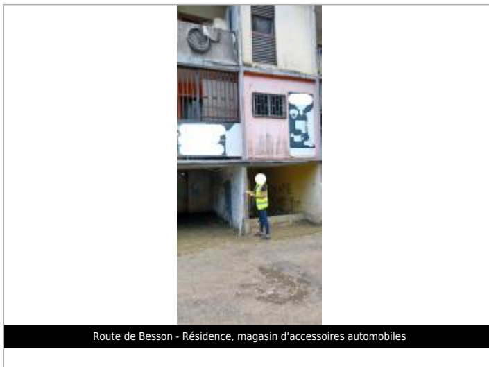
Route de Besson - Résidence, magasin d'accessoires automobiles

Coordonnées RGF93 (ETRS89) : X: -61.521165 / Y: 16.239376