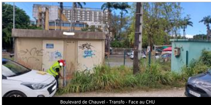
Boulevard de Chauvel - Transfo - Face au CHU