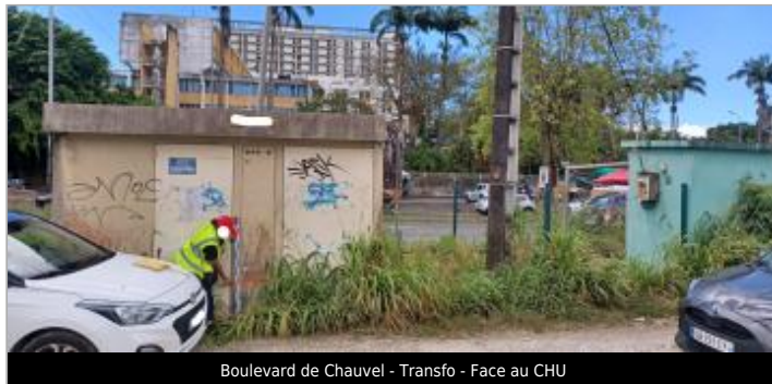
Boulevard de Chauvel - Transfo - Face au CHU