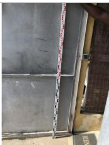
Route de Cocoyer / Labrousse

Différence entre le niveau d'eau et la référence (en m) : 1.420 m