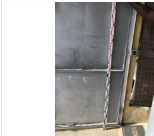
Route de Cocoyer / Labrousse