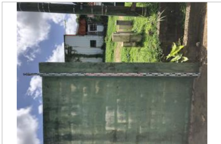
Dépôts de matières solides (en haut du mur)

SOURCE DE REPÉRAGE : CAMPAGNE DE RELEVÉS TERRAIN DEAL 971 AVRIL 2022 - 30/04/2022