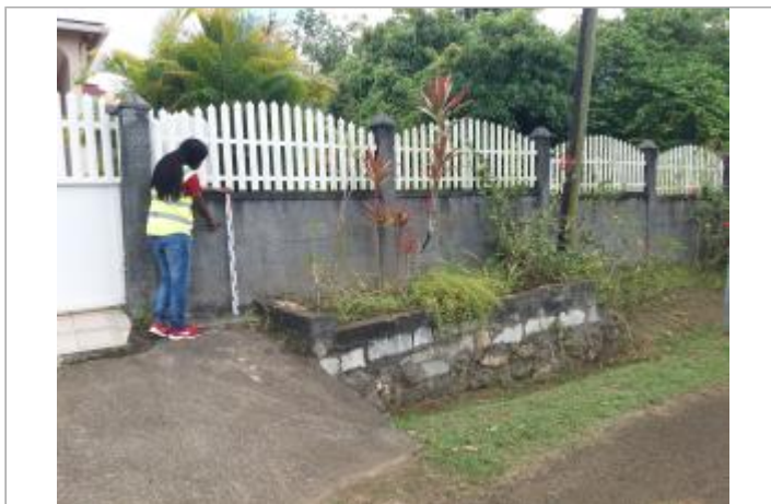
Mur de clôture