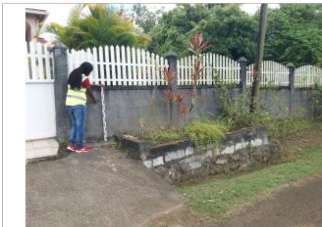
Mur de clôture