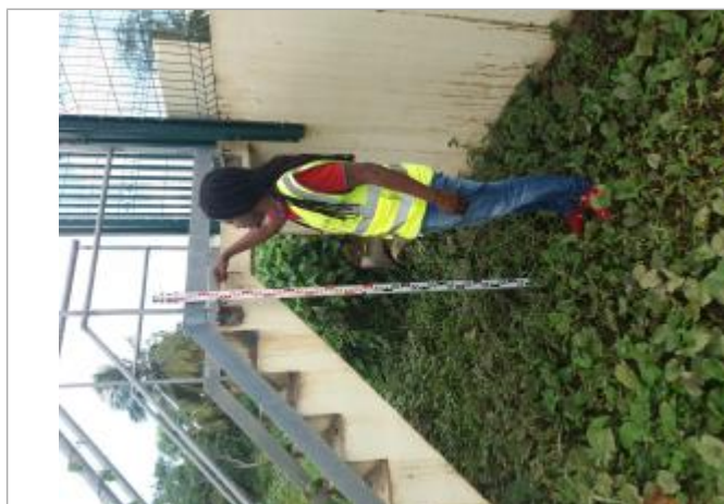
Potentiel dépôt de matières solides