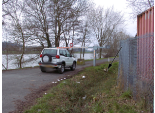
Vue du site BDHE 2174 point de repère 2445

Coordonnées WGS84 : X: 0.73853517 / Y: 47.37107228