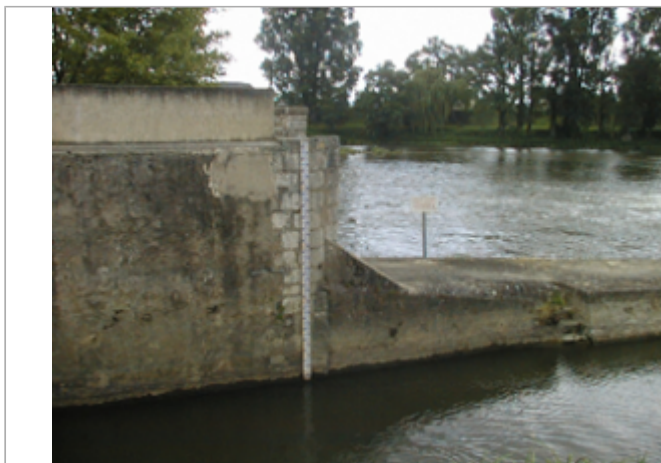
Vue du site BDHE 2122 point de repère 2368