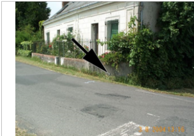
Vue du site BDHE 2119 point de repère 2457