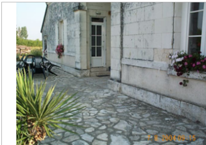
Vue du site BDHE 2089 point de repère 2489