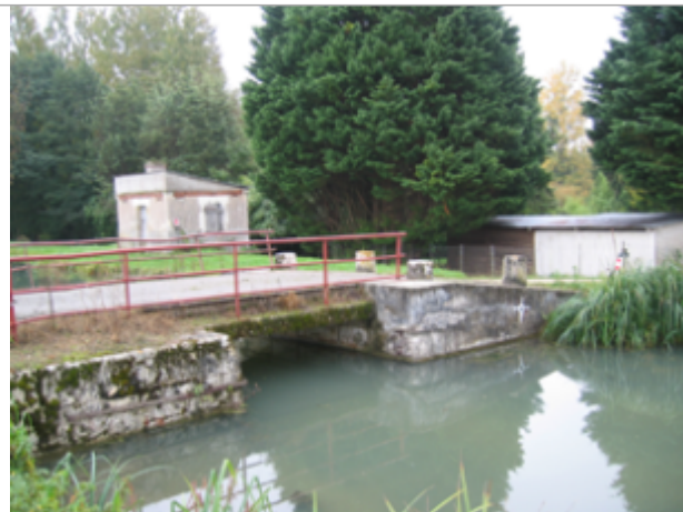
Vue du site BDHE 2083 point de repère 2438