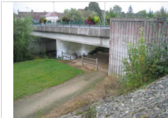
Vue du site BDHE 2079 point de repère 2436