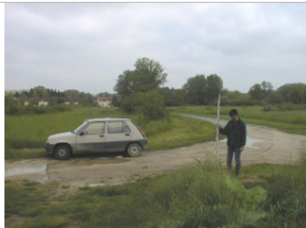
Vue du site BDHE 2077 point de repère 2229