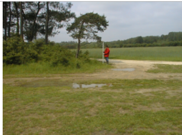
Vue du site BDHE 2071 point de repère 2221

Coordonnées WGS84 : X: 1.70406598 / Y: 47.27103551