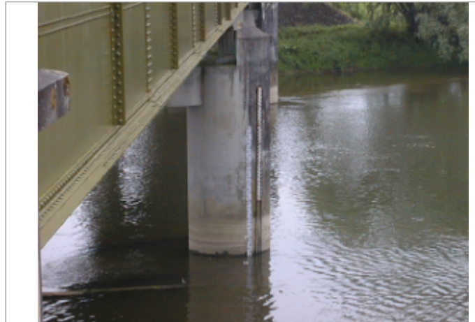
Vue du site BDHE 2055 point de repère 2190

Coordonnées WGS84 : X: 2.15165313 / Y: 47.16815999