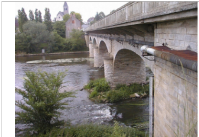
Vue du site BDHE 2050 point de repère 2180