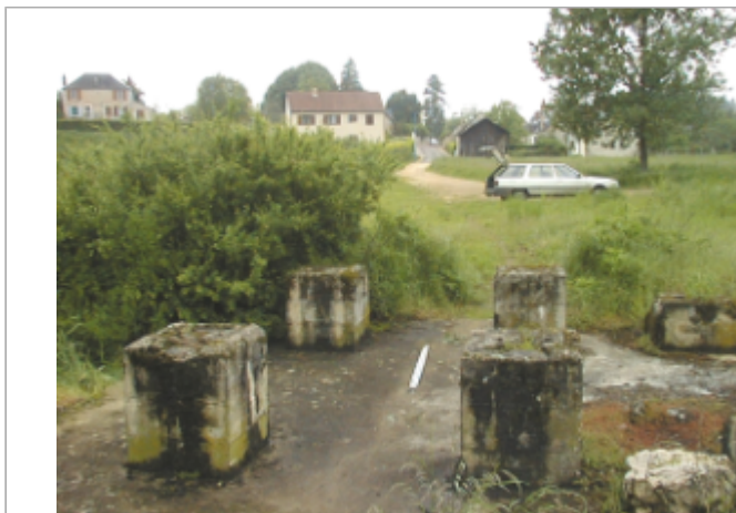
Vue du site BDHE 2045 point de repère 2169