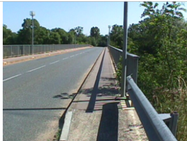
Vue du site BDHE 2044 point de repère 2168

Coordonnées WGS84 : X: 2.27031474 / Y: 46.93904344