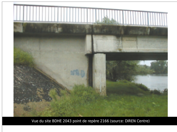
Vue du site BDHE 2043 point de repère 2166