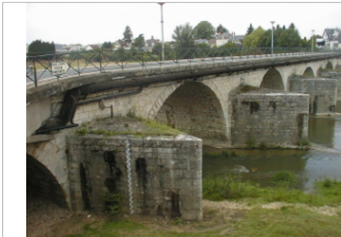
Vue du site BDHE 2080 point de repère 2232