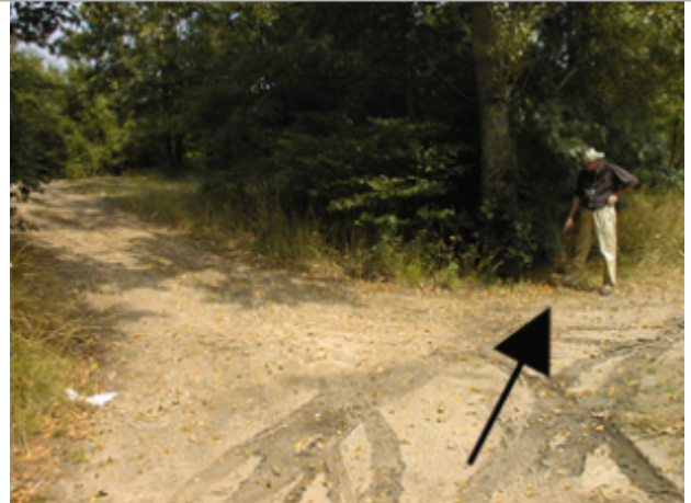
Vue du site BDHE 2076 point de repère 2227

Coordonnées WGS84 : X: 1.62241504 / Y: 47.27483062