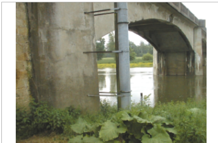
Vue du site BDHE 2069 point de repère 2217