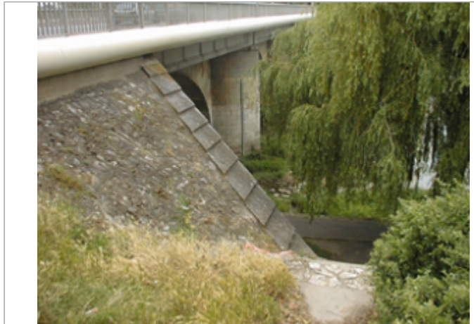
Vue du site BDHE 2116 point de repère 2358

Coordonnées WGS84 : X: 0.69621293 / Y: 47.37215017