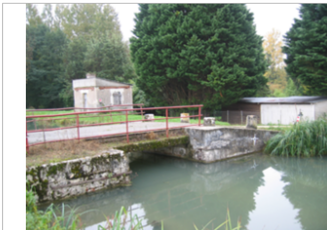
Vue du site BDHE 2083 point de repère 2438