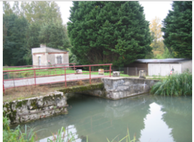
Vue du site BDHE 2083 point de repère 2438

Coordonnées WGS84 : X: 1.45961001 / Y: 47.26511144