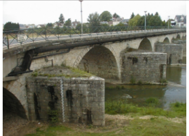
Vue du site BDHE 2080 point de repère 2232