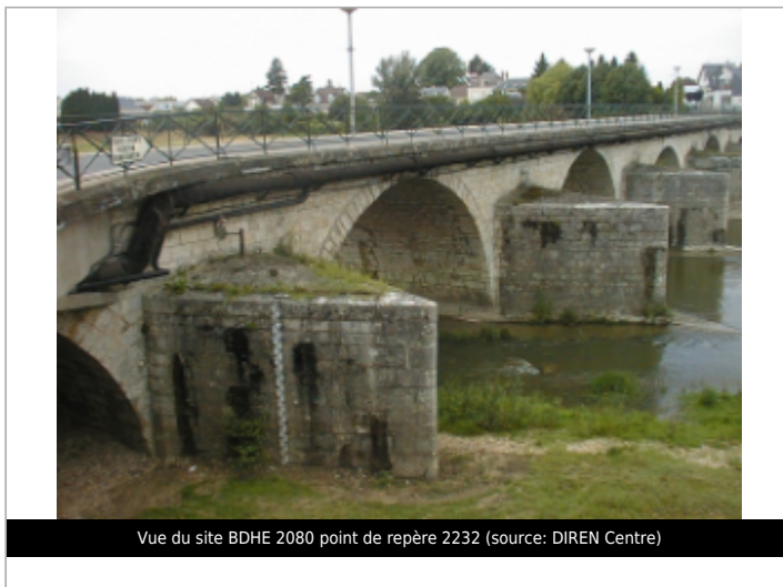
Vue du site BDHE 2080 point de repère 2232