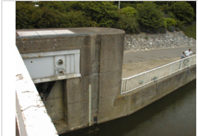
Vue du site BDHE 2115 point de repère 2354