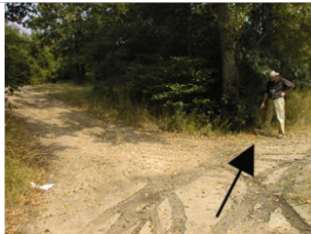
Vue du site BDHE 2076 point de repère 2227