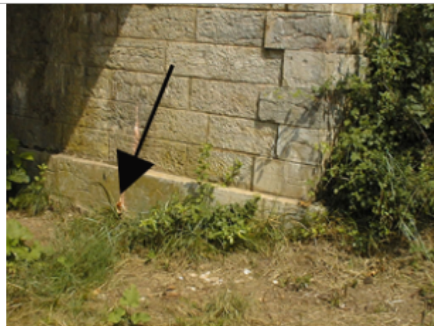
Vue du site BDHE 2074 point de repère 2225