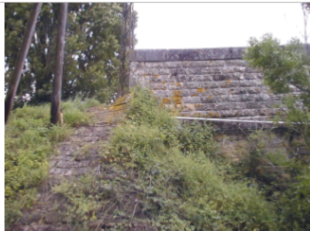
Vue du site BDHE 2065 point de repère 2208