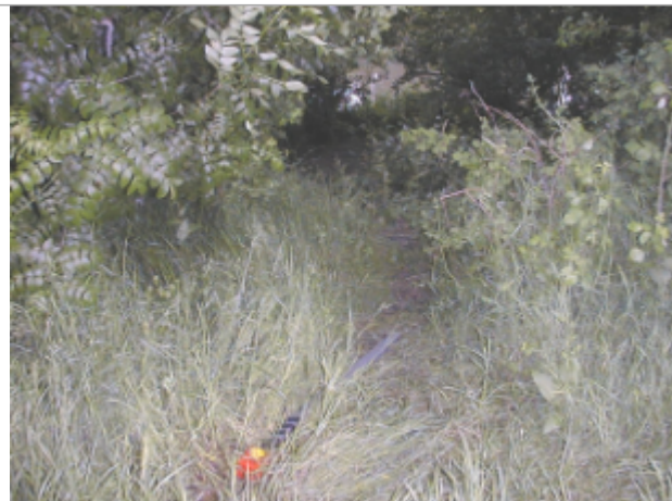
Vue du site BDHE 2052 point de repère 2183 (source: DIREN Centre)

Coordonnées WGS84 : X: 2.16852531 / Y: 47.11942969