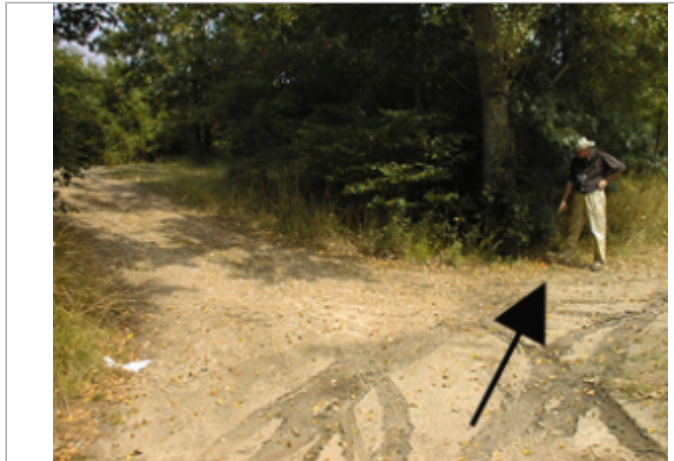
Vue du site BDHE 2076 point de repère 2227

Coordonnées WGS84 : X: 1.62241504 / Y: 47.27483062