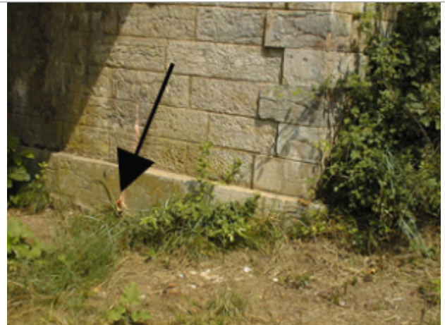
Vue du site BDHE 2074 point de repère 2225

Coordonnées WGS84 : X: 1.64969486 / Y: 47.26164561