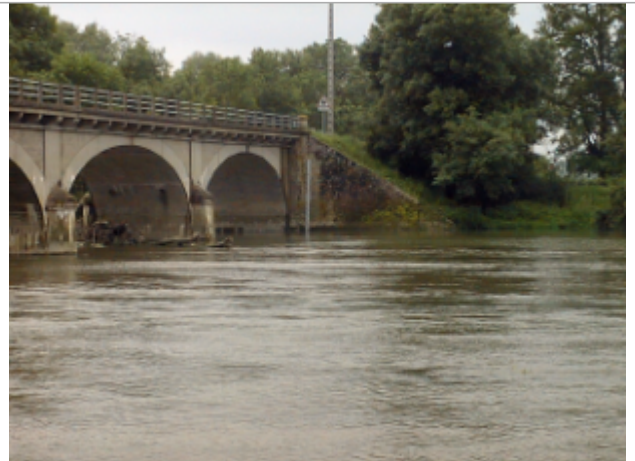
Vue du site BDHE 2064 point de repère 2207

Coordonnées WGS84 : X: 1.92241351 / Y: 47.25035564