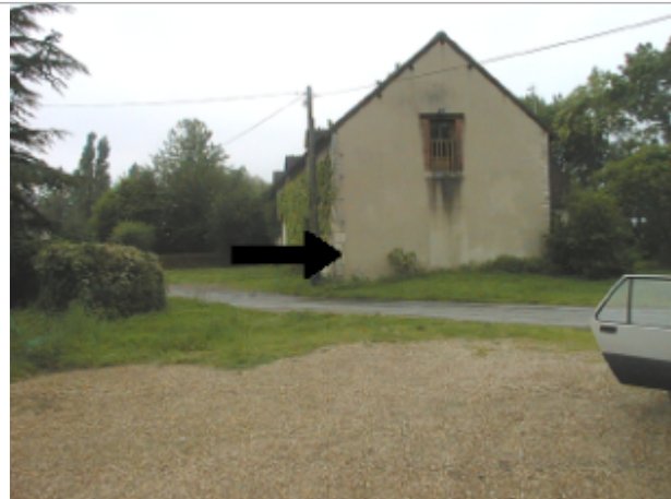
Vue du site BDHE 2062 point de repère 2203