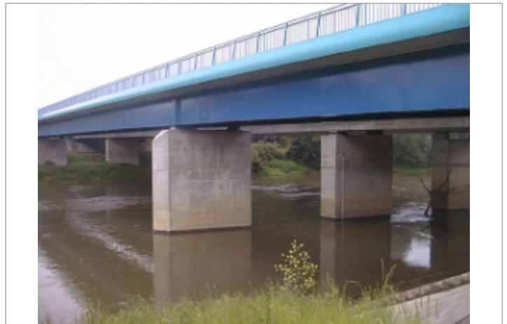
Vue du site BDHE 2060 point de repère 2201