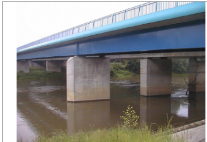
Vue du site BDHE 2060 point de repère 2201

Coordonnées WGS84 : X: 2.04043409 / Y: 47.21800806