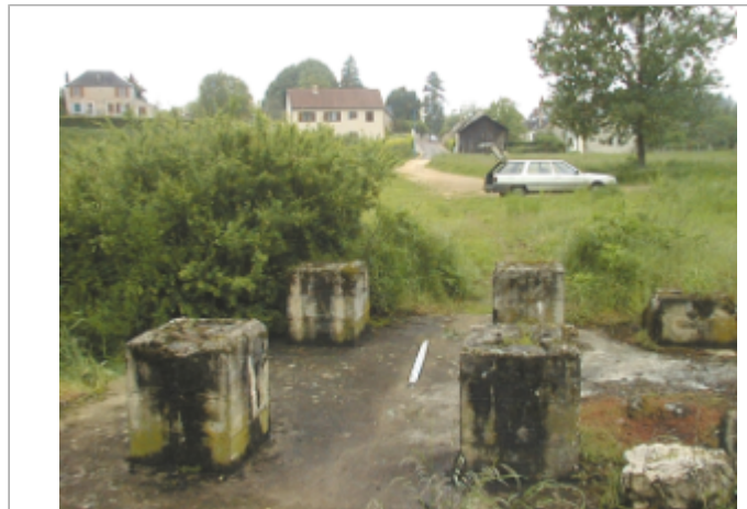
Vue du site BDHE 2045 point de repère 2169

Coordonnées WGS84 : X: 2.25426450 / Y: 46.96661880