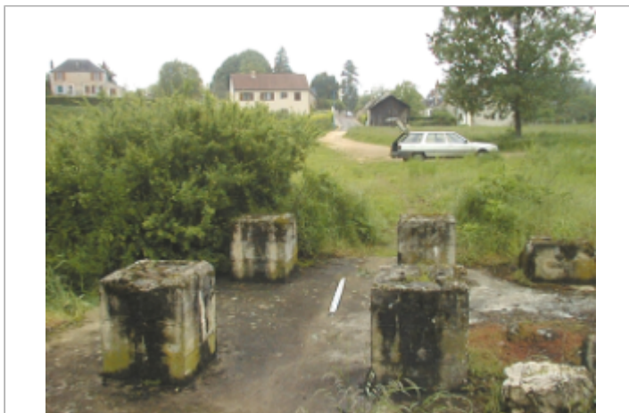
Vue du site BDHE 2045 point de repère 2169