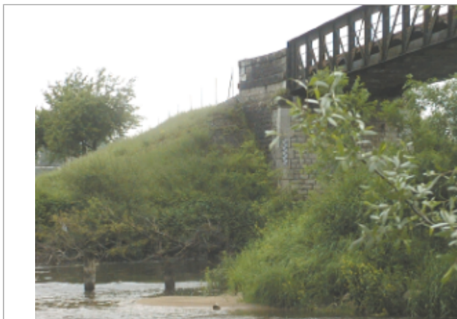
Vue du site BDHE 2042 point de repère 2165