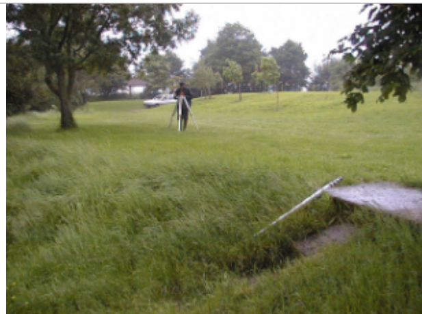
Vue du site BDHE 2038 point de repère 2103

Coordonnées WGS84 : X: 2.34642559 / Y: 46.81971046