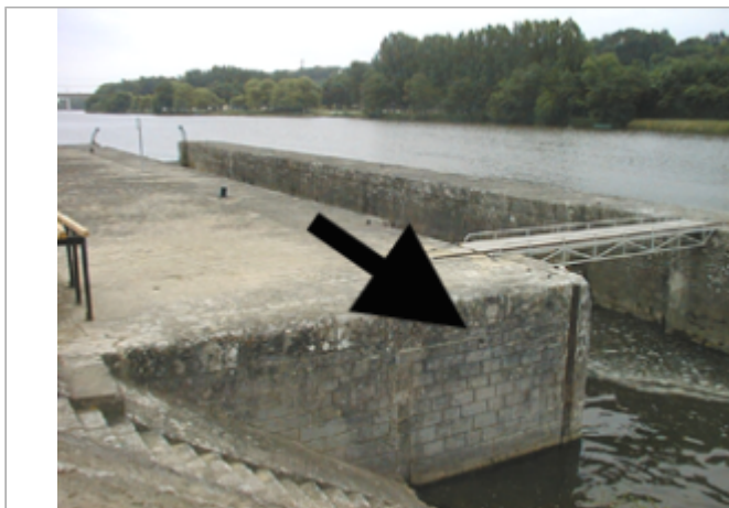
Vue du site BDHE 2113 point de repère 2348