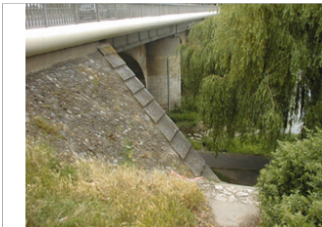
Vue du site BDHE 2116 point de repère 2358