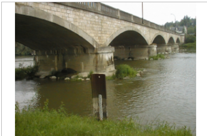
Vue du site BDHE 2067 point de repère 2214