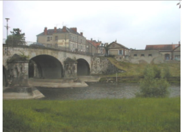
Vue du site BDHE 2059 point de repère 2199

Coordonnées WGS84 : X: 2.06570337 / Y: 47.21782739